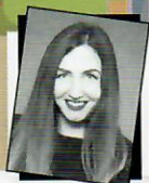
Konsultavo Advokatų kontorą ADVOCATERA advokatė